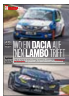
24h-Rennen Nürburgring Ausgabe 22|24, EVT 30.05.2024