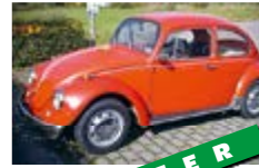
VW Käfer 1200 ...mentline, 6.1970, 1271km ...ser: H-Kennz., alles original, 6 ...metferreinigungsanlage, Nebelscheinwerfer, Skisack, guter Zustand, X.XXX,- Euro , Tel. 00000-000000.

Der Ratgeber-Teil bietet leicht verständliche Tipps und Anleitungen zu Wartung, Reparatur und Restaurierung, aber auch zu Reifen, Pflege und Versicherung. Unsere Experten bewerten Modellautos und Bücher genau so, wie alle AUTO BILD KLASSIK-Redakteure arbeiten: kritisch und kompetent. AUTO BILD KLASSIK fängt da an, wo andere aufhören.