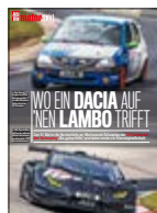
24h-Rennen Nürburgring Ausgabe 25|25, EVT 18.06.2025

AUTO BILD MOTORSPORT kann mit anderen Titeln des Axel Springer Auto Verlages kostengünstig kombiniert werden (siehe gesondertes Tarifblatt). Bitte beachten Sie auch die folgenden Sonderthemen, Formate und Preise (siehe Preisblatt Themenspecials) sowie unsere Sonderpublikationen - die Konditionen finden sich auf dem Preisblatt „Sonderpublikationen“.