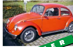
VW Käfer 1200 ...mettime, 6.1970, 1271km, ...H-Kennz., alles original, 6...wetter, Skisack, guter Zustand, X.XXX,- Euro , Tel. 00000-000000.